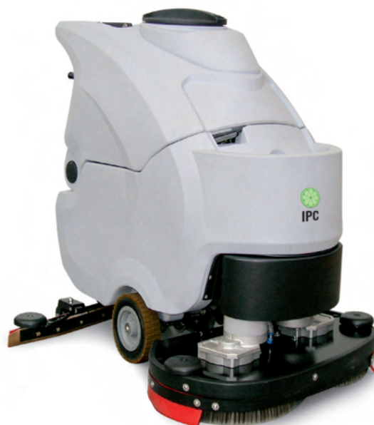
CT 70 BT 60 / BT 70