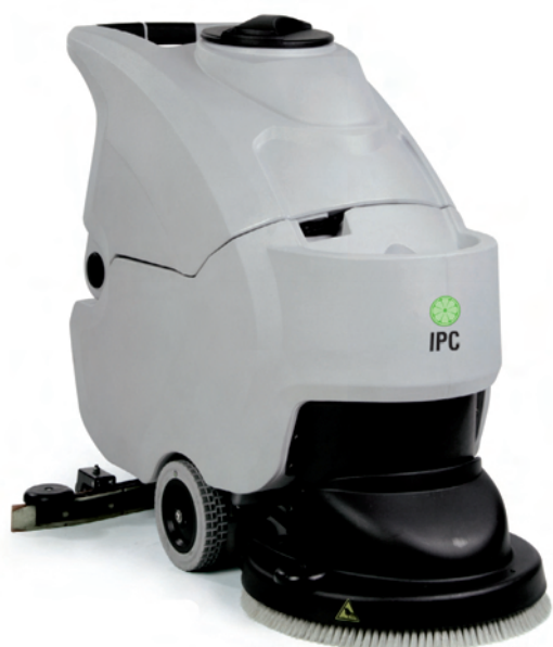
CT 70 C50 / B50